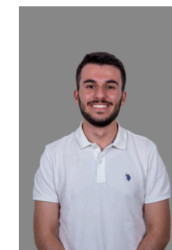
Kerem Kundenberatung und Strategische Beratung